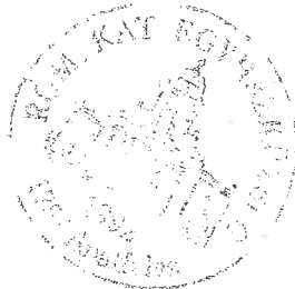
Salamon László plébános