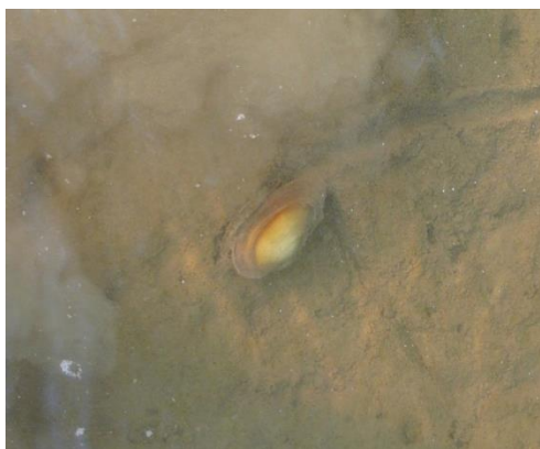
Kagyló a Marosban 2011. 09.