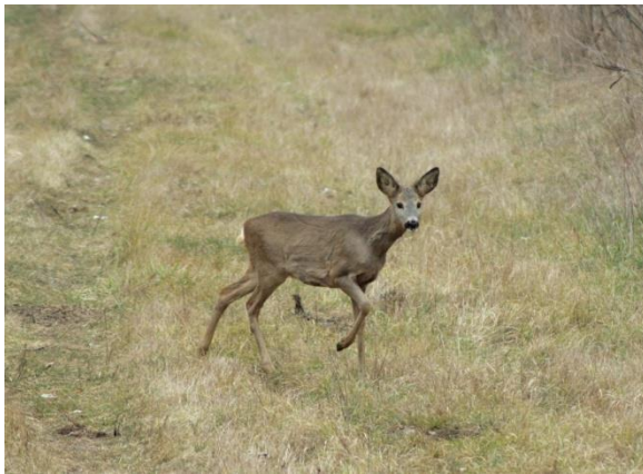
Vancsó Dénes képei.2019