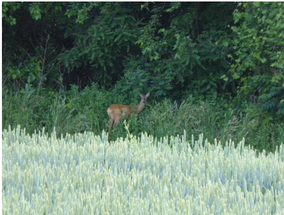
Varga Réka fotója 2019