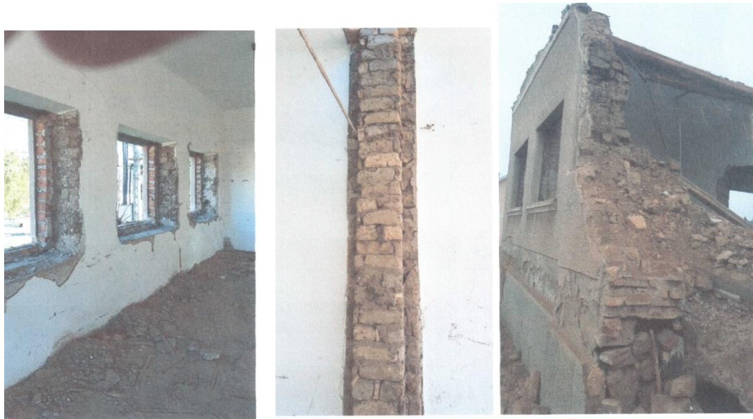
A Sinka iskola fő fala vályogból készült.