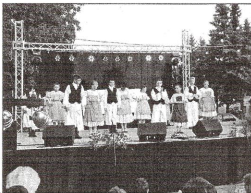
Kardos István Néptáncsoport