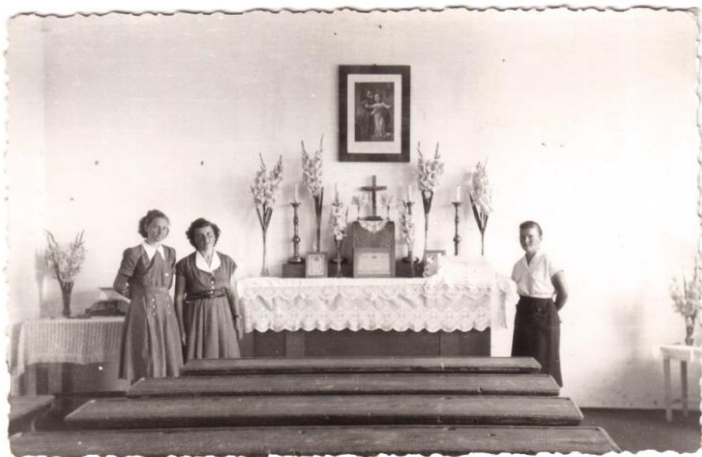
Külsőtanyai iskola, vasárnapként itt volt a szentmise. 100 Ft-ot adományozott.