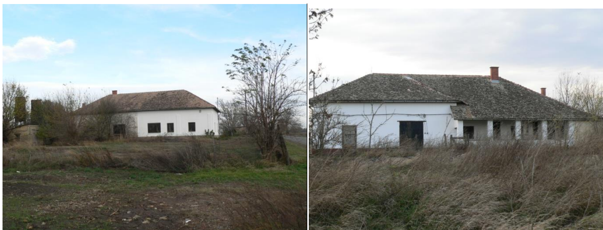
A hajdan volt belső tanyai iskola