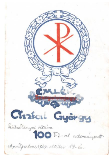
Antal György külsőtanyai oltárra