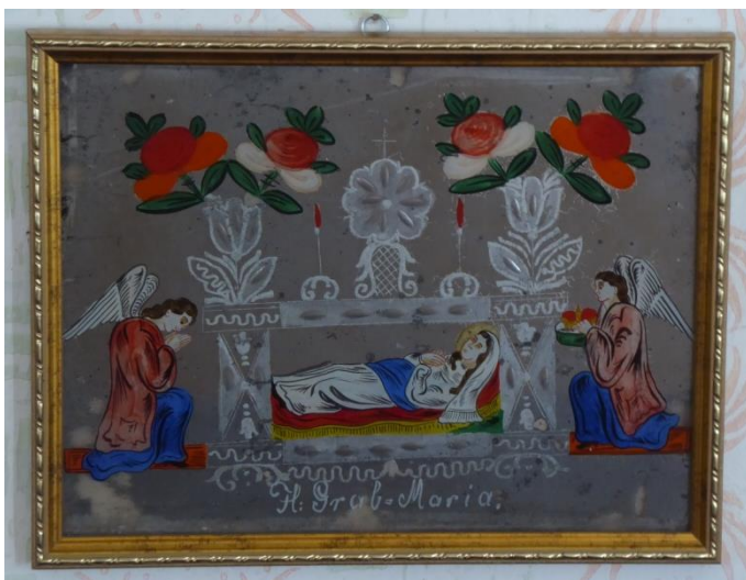
Tükrös szentkép. Nagy értéket képviselt.