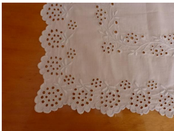
A borítón levő béles takaró részlete