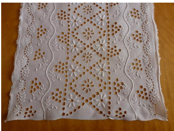
Párnavég, 19. századi minta