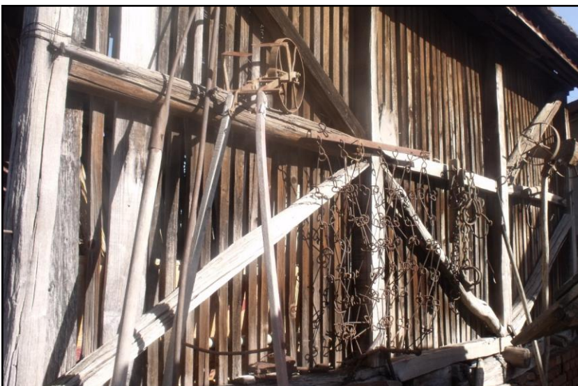
A kotárka oldala