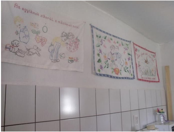
A folyosó Teakonyha