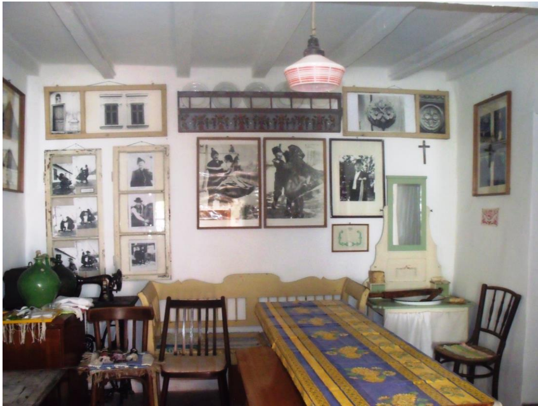
A „pitar” Középső szoba