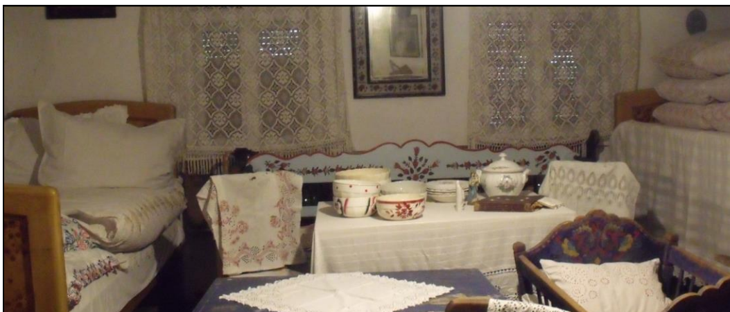
Eszterlác Ház: Tiszta szoba