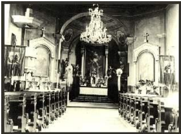
Templombelső az átépítés előtt