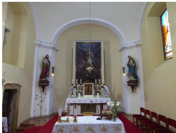
A vörös márványborítású liturgikus tér és szembemiséző oltár