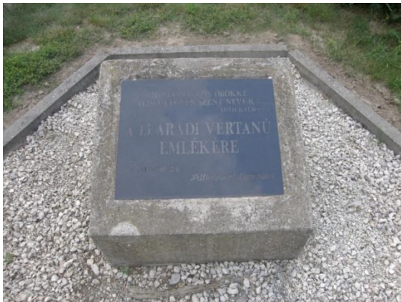
Aradi vértanúk emléktábla