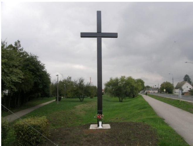
Szent Anna kereszt 2015. 05.