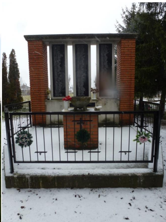
Második világháborús emlékmű a temető bejáratánál 2015. 12.

2.A Htv. 1. § (1) bekezdés j) pontjának való megfelelést valószínűsítő dokumentumok, támogató és ajánló levelek