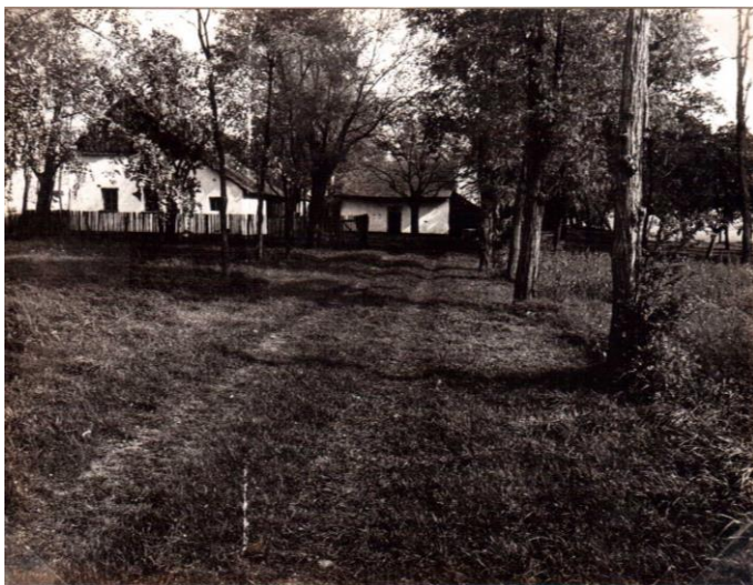
Tanya léckerítéssel földúttal és fasorral.

1. Az értéktárba felvételre javasolt nemzeti érték fényképe vagy audiovizuális-dokumentációja