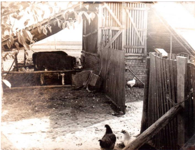
Góré és nyári istálló összeépítve