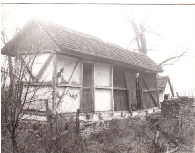
Összeépített hambár és kotárka