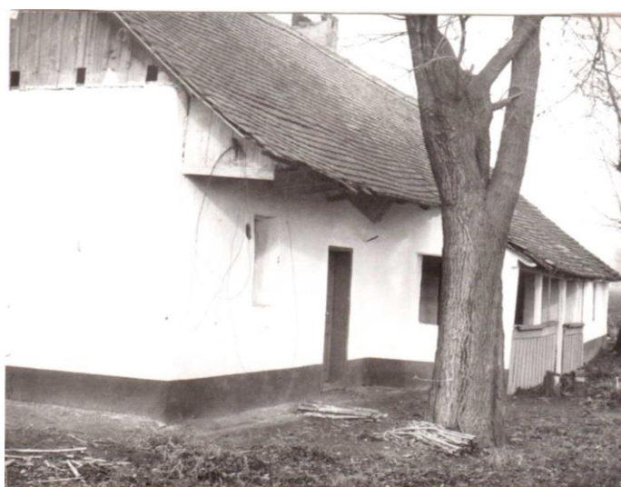
Tanyához épített istálló