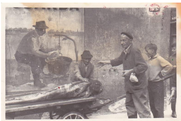
A kép a faluház tulajdona