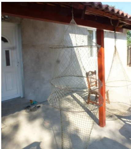
A képek Langó Imre halász házánál készültek.